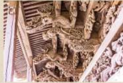
金比羅権現の彫刻群

山門、堂、隣接する金比羅権現(1833年に建立)に施された精巧な彫刻群は圧倒的。棟梁は羽茂の高野甚右衛門良春、彫刻は門人の謙蔵作と棟札に記されている。