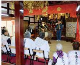
法話を聴くお遍路さん。写真上と左は29番札所 安照寺。