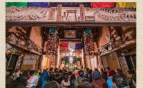
毘沙門青祭りの様子

初め天台宗で平泉寺といい、毘沙門堂の別当寺だったため、毘沙門天の侍者の百足信仰が伝わっている。