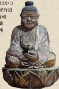
木食行道刻 薬師如来座像

奥の院 釈迦堂はかつて木食行者の修行道場で、木食行道刻の地藏菩薩と薬師如来座像が残されている。