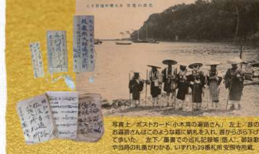
写真上「ポストカード「小木高の遍路さん」」左上「昔のお遍路さんはこのような箱に納札を入れ、昔からぶら下げて歩いた。左下「墓曹での地札記録簿(個人)」。御縁歌や当路の札番がわかる。いずれも29番札所 安照寺所蔵。

お参りの仕方と心得 一、札所に着いたらご挨拶をします。 (一) 門で合掌一礼します。 (二) 手を洗い、口を漱ぎ、身を清めます。 (三) 入り鐘を一回だけ撞きます。 二、本堂・大師堂それぞれの正面でお参りします。 (一) 燈明・線香・賽銭を献納します。 (二) 写経・納札を納めます。 (三) 動行します。 (般若心経・光明真言・南無大師遍照金剛ほか) 三、御朱印料を納めます。 四、帰りにもう一度門で合掌一礼します。 ※霊場めりは本来、修行の旅です。 道中はマナーやルールを守り、お参り致しましょう。