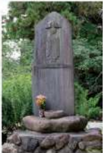
佐渡一國遍路開創記念碑

佐渡ヶ島は周囲280.4km、面積は855km 2 (東京23区の1.4倍)。朱鷺の島、花の島、歴史の島、人情の島、信仰の島である佐渡で、他では体験できないお遍路をお楽しみください。佐渡ヶ島は四季折々にお遍路さんをやさしく迎えてくれることでしょう。