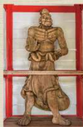
長安寺仁王門の金剛力士像

はじめ天長寺と称し、天台宗の流れを汲んでいたが、天正17(1589)年以後、真言宗に改宗した。夏は堂の舞う清流の側にあり、茅葺の仁王門から躍動的な金剛力士像(市指定文化財)が迎えてくれる。