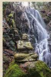
文覚上人像と鍋倉の滝

養和元(1181)年、佐渡に流された文覚上人の開基とされ、3年9ヶ月滞在したと言われる史跡。奥の院に大日堂、その側に上人が滝行をしたという鍋倉の滝がある。